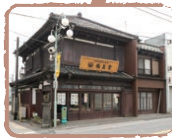
歴史を感じる街並み