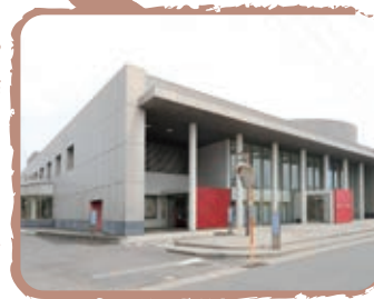
八日市場図書館・公民館