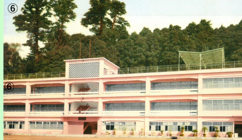
現在も使用している本校舎⑥は昭和39年に完成しています。昭和39年は、東京オリンピックが開催され、東海道新幹線が走り始めるなど、高度成長時代を迎えた日本は更なる発展に向けて走り続けていました。その後、昭和45年には大阪万国博覧会が、高度経済成長を成し遂げアメリカに次ぐ経済大国となった日本の象徴的な意義を持つイベントとして開催されました。本校も、日本の発展に合わせるかのように「海の家」や横芝校舎、敬天閣など次々と新たな施設を建設していきました。