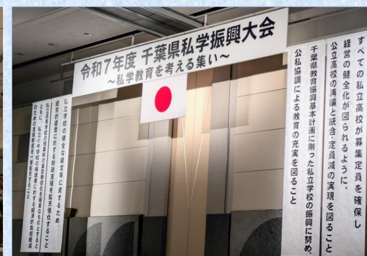
左 会場内の様子 右 大会決議