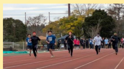
左より 飲み物提供 競技の様子